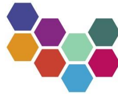
SÓKNARÁÆTLUN NORÐURLANDS EYSTRÁ