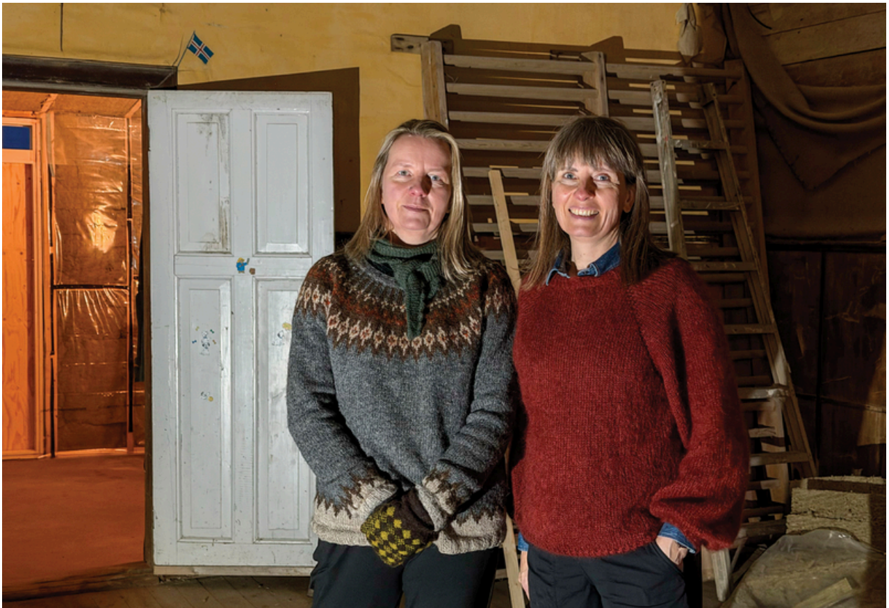
Efri mynd: frá BAUN: Barnamenningarhátíð í Reykjanesbæ.